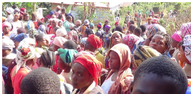
> Population de Chanjavu

Situé à 45 km à l'ouest de la ville de Bukavu, le long de la route nationale n° 2, le groupement de Walungu fait partie des seize groupements qui composent la collectivité-chefferie de Ngweshe, dans le territoire de Walungu.