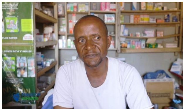
> Médecin du quartier dans la Pharmacie

Dans l'avancement du projet et au lieu de continuer à louer le local abritant la pharmacie, une famille a cédé une portion de sa parcelle afin d'y construire un petit bâtiment de deux locaux, dont l'un pour la pharmacie et le second servira au cabinet médical, lieu de travail du médecin du quartier qui consulte préalablement chaque patient avant de lui prescrire et lui recommander les médicaments à acheter.