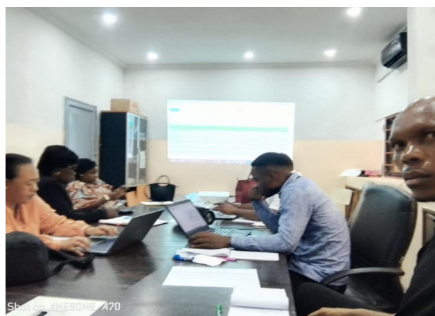
> Le Représentant de la Fondation Humanité en réunion du Cluster Education

Cette adoption témoigne de la reconnaissance de son rôle comme partenaire stratégique, capable de contribuer à la coordination des efforts nationaux et internationaux pour une éducation de qualité. Elle ouvre la voie à une collaboration renforcée, où tous les acteurs du cluster travaillent main dans la main pour offrir aux jeunes congolais les outils nécessaires à leur réussite et à leur avenir.