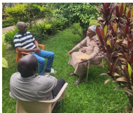
> Notables en consultation

Dans l'avancement du projet et au lieu de continuer à louer le local abritant la pharmacie, une famille a cédé une portion de sa parcelle afin d'y construire un petit bâtiment de deux locaux, dont l'un pour la pharmacie et le second servira au cabinet médical, lieu de travail du médecin du quartier qui consulte préalablement chaque patient avant de lui prescrire et lui recommander les médicaments à acheter.