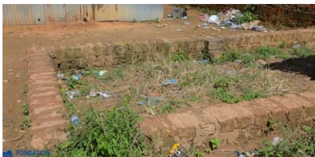
> Travaux de construction de la pharmacie

Dans leurs réflexions communautaires et en vue de pérenniser cette initiative, les initiateurs du projet, avec le concours du Chef de quartier, planifient d'acheter carrément une portion de terre afin d'y ériger définitivement une pharmacie construite dans les normes ainsi qu'un cabinet médical.