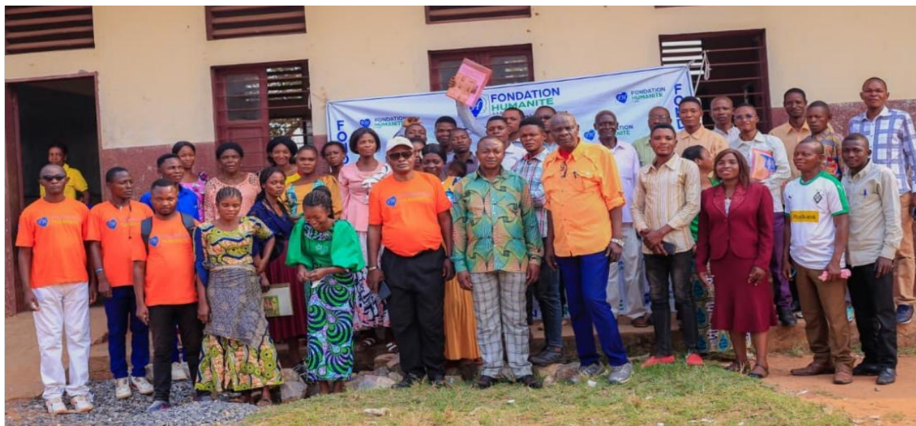
> Participants à la formation à Tshilenge

De manière plus concrète, cette deuxième édition de formation a poursuivi un double objectif stratégique, à savoir d'une part, élargir le réseau des praticiens d'une pédagogie transformative, laquelle se propose de promouvoir et de déployer la pédagogie basée sur la noblesse intrinsèque de l'âme humaine afin de contribuer à une transformation profonde et durable de la société et, d'autre part, enrichir la boîte à outils pédagogiques par la contribution à l'amélioration concrète des méthodes et techniques d'enseignement adaptées aux enjeux modernes.