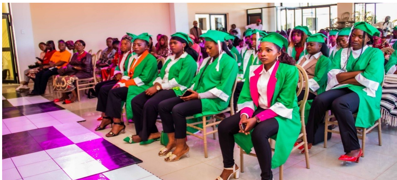
> Lauréats d'une formation professionnelle organisée à Lubumbashi

Face à ce constat, la « Fondation Humanité » a lancé un programme de formation professionnelle en métiers porteurs (couverture, mécanique et ajustage, maçonnerie, esthétique, informatique) pour offrir aux jeunes et femmes en état de vulnérabilité des compétences techniques et pratiques leur permettant de s'insérer sur le marché du travail ou de créer leurs propres micro-entreprises.