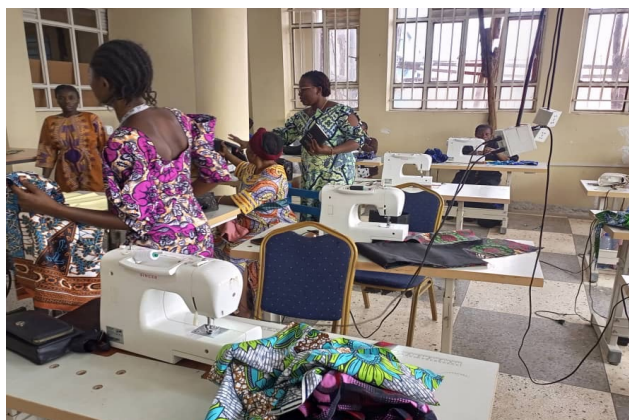
> Participantes à la formation en coupe et couture à Bukavu

La formation est à 70% pratique et à 30% théorique, avec des formateurs qualifiés issus des centres partenaires. Sachant que la formation à elle seule ne suffit pas, la Fondation Humanité prévoit d'organiser des sessions de recyclage ou perfectionnement pour renforcer les compétences acquises.