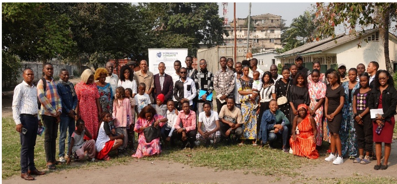
> Participants à la formation à Kinshasa

La formation a été conçue pour avoir un impact national, en ciblant spécifiquement des centres urbains et des localités pour une couverture optimale. Les thématiques abordées ont été adaptées avec sensibilité au contexte local de chaque région, répondant directement aux difficultés didactiques et docimologiques identifiées.