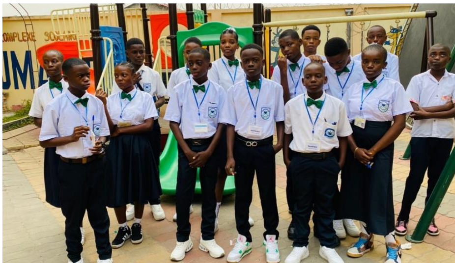
> Lauréats finalistes de l'éducation de base

Signalons que le CSH a vu deux de ses promotions finalistes de l'école primaire et de l'éducation de base réaliser un sans-faute soit cent pourcent de réussite aux tests ENAFEP et TENASOSP. A la fin de la deuxième année scolaire, les résultats enregistrés, la qualité de formation ainsi que le niveau affiché par les élèves n'ont fait que confirmer le statut de grand centre de formation du Complexe Scolaire Humanité.