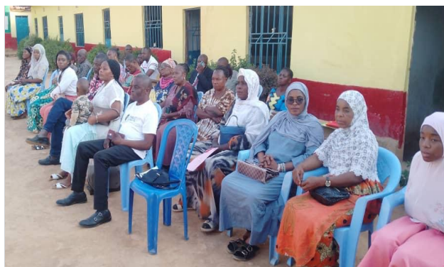
> Réunion Communautaire

Ce projet, suivi désormais par les autorités locales, donne l'exemple de la construction communautaire où une population d'un quartier ou d'un village donné se consulte, réfléchit, planifie et met en œuvre des actions qui sont profitables à l'ensemble de sa population .