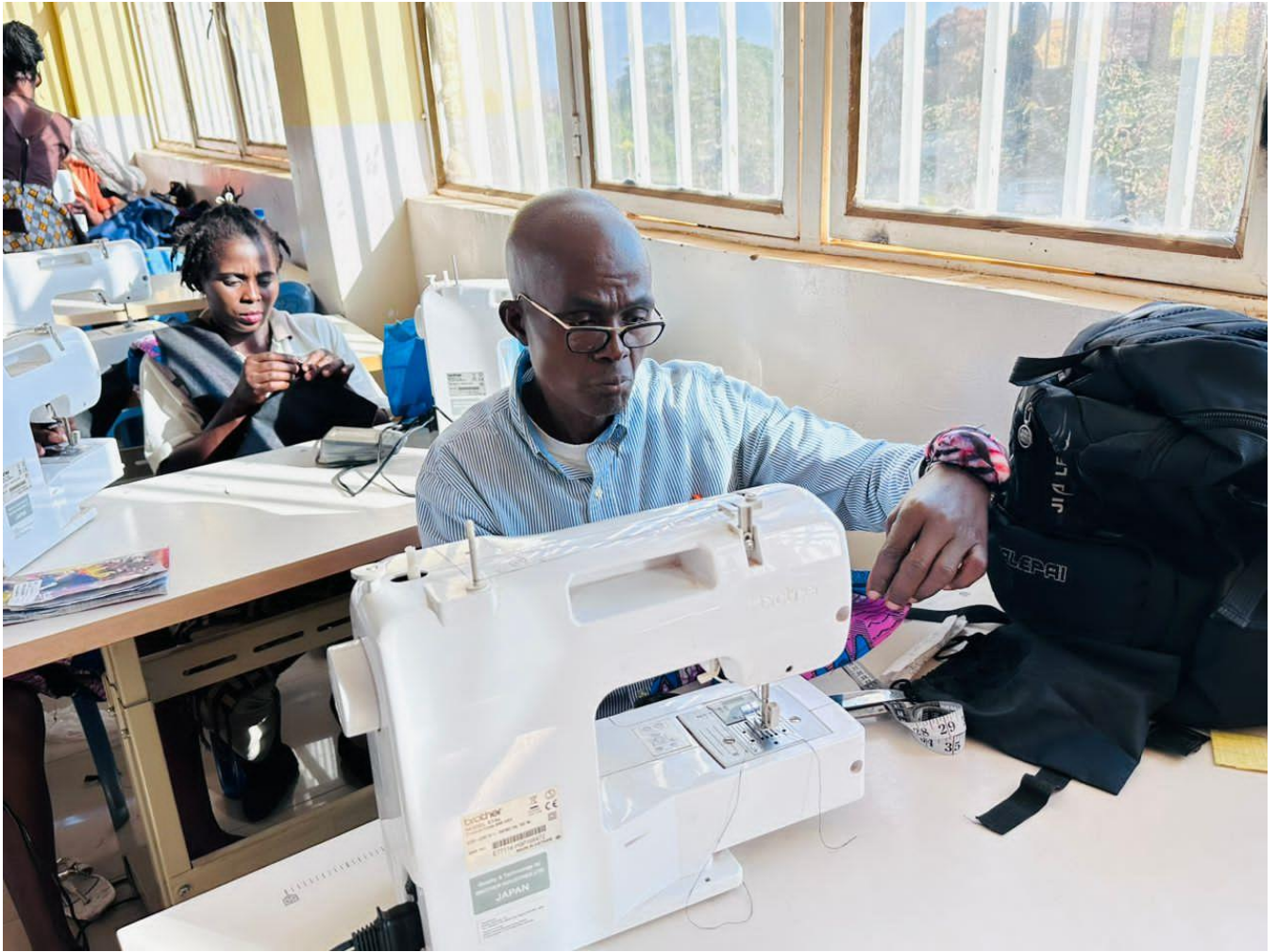
Formation en coupe et couture à Lubumbashi