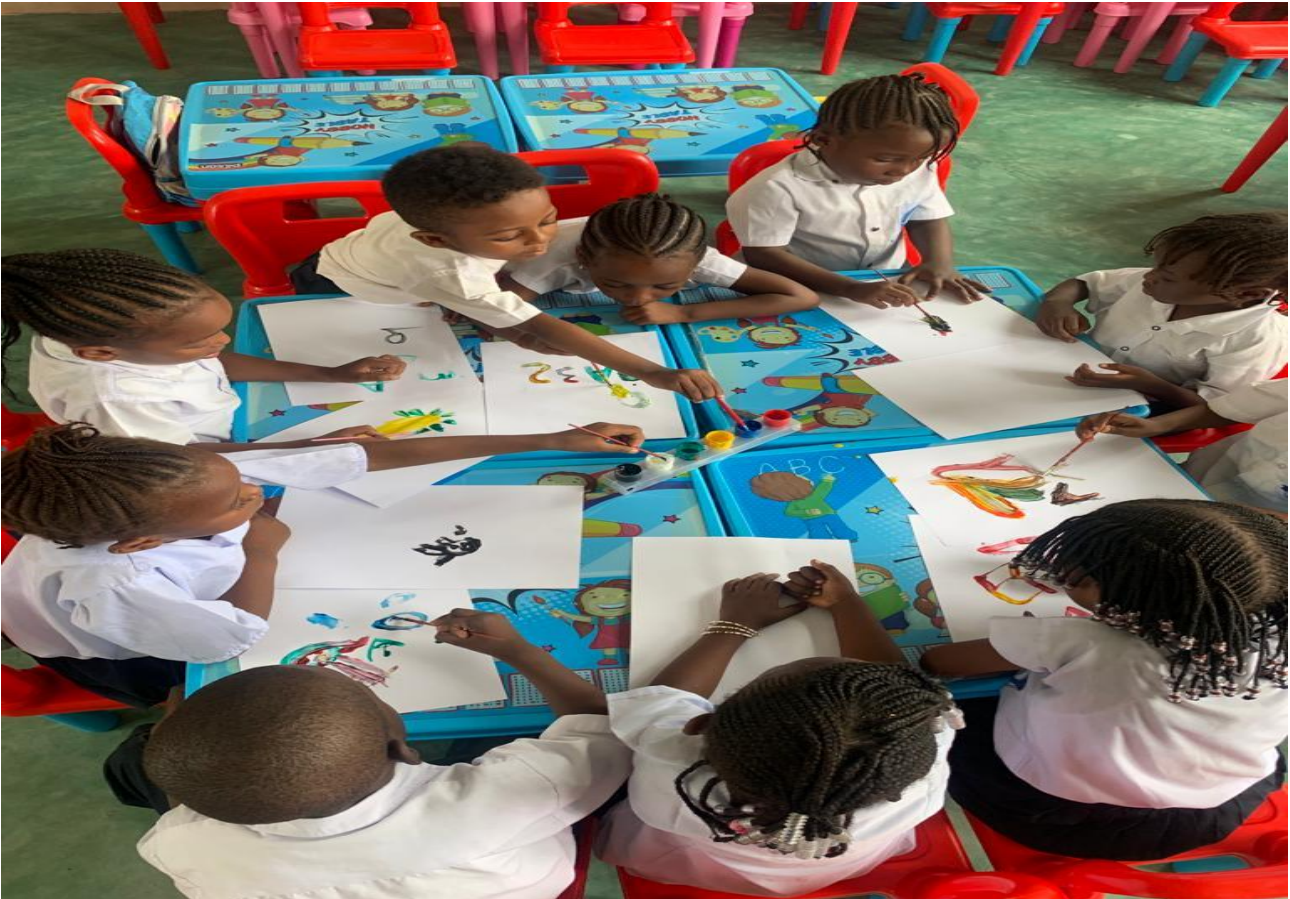
Quelques élèves de la maternelle en pleine session de dessin et expression artistique.