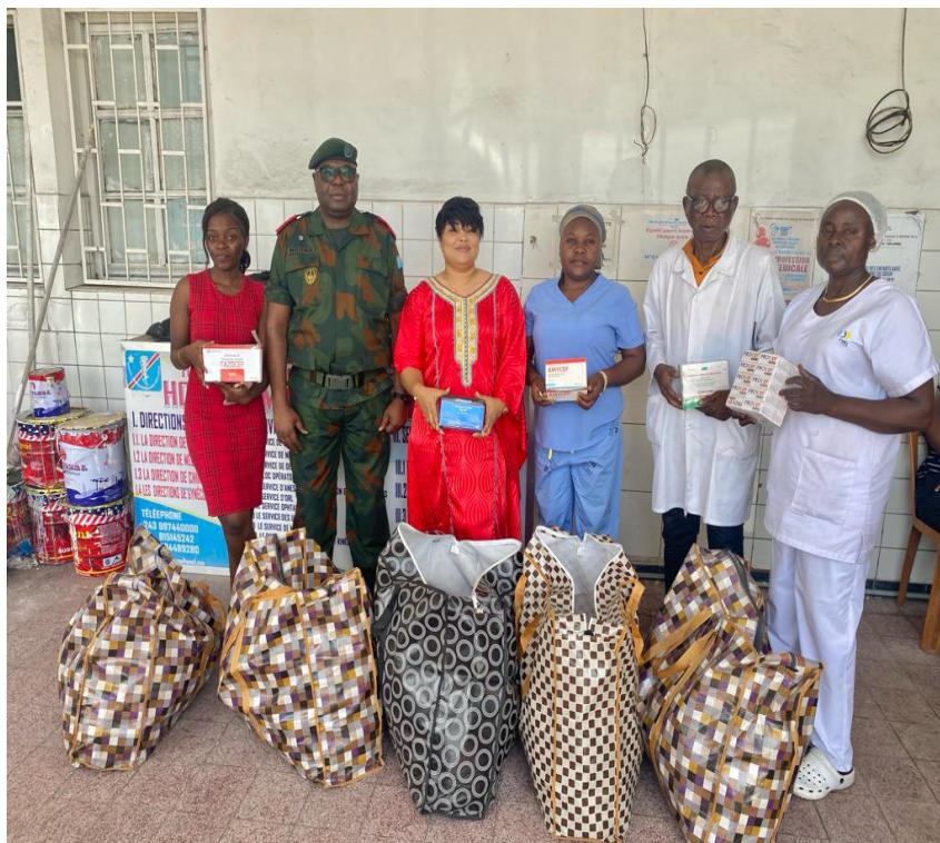
Les membres de la FH en compagnie des responsables de l'hôpital générale du Camps Kokolo