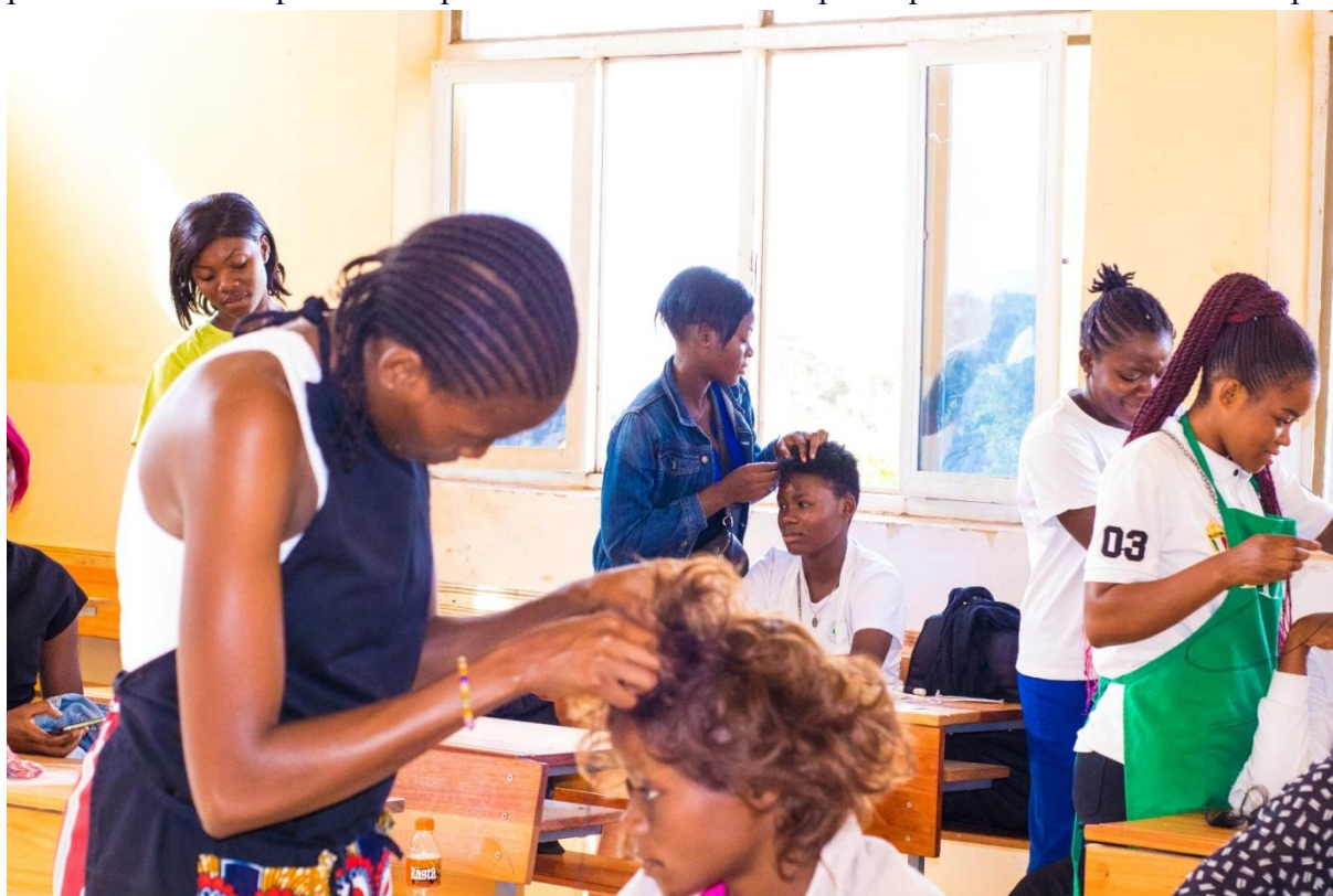
Des jeunes filles en pleine formation d'esthétique à Lubumbashi.