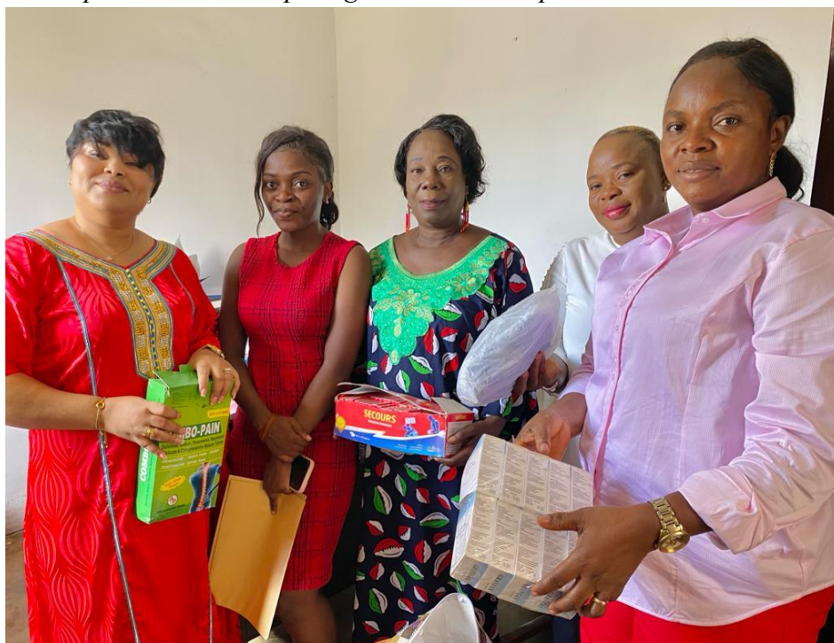
Les membres de la FH avec les responsables du home des vieillards de Cabinda