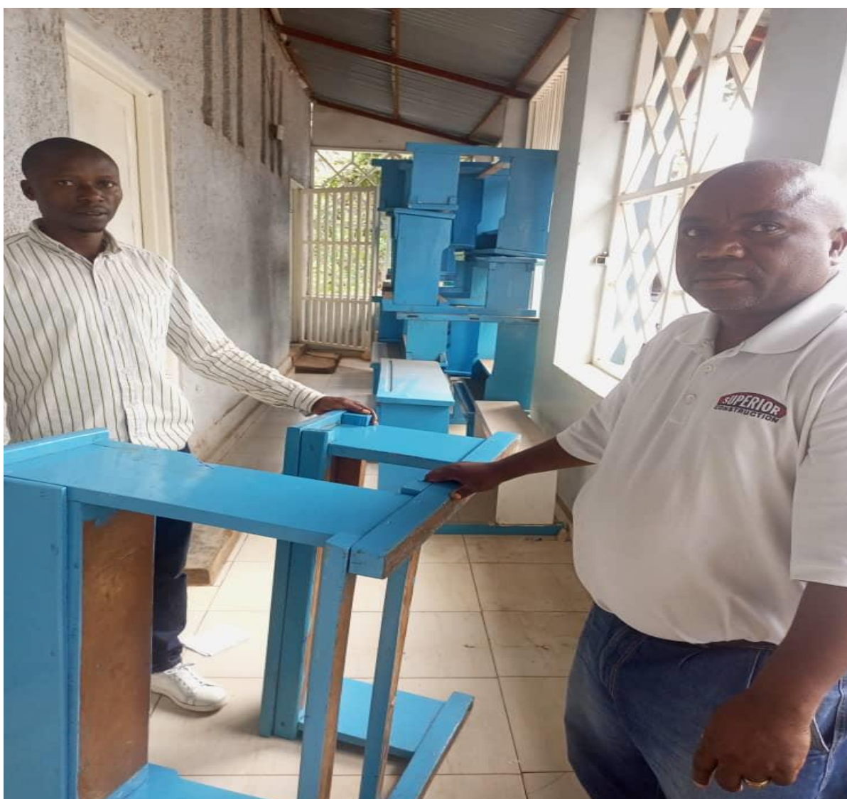
Distribution des bancs à Bukavu.